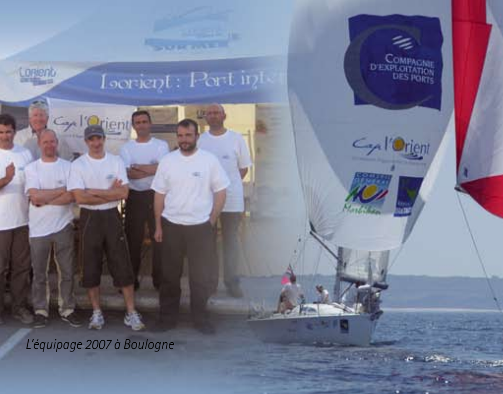
L'équipage 2007 à Boulogne